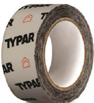
TYPAR® CINTA DE CONSTRUCCION Rollo de 4.76 cm x 50.3 ml