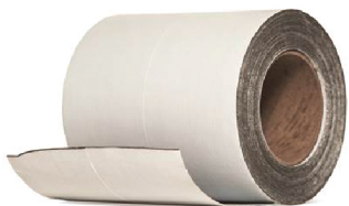
TYPAR® CINTA REGULAR Rollo de 15.24 cm x 22.8 ml