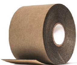
TYPAR® CINTA FLEXIBLE Rollo de 15.24 cm x 22.8 ml

La cinta para construcción Typar® permite pegar rápidamente los solapes de las barreras con iguales condiciones de resistencia a los rayos UV y climas extremos que las propias barreras.